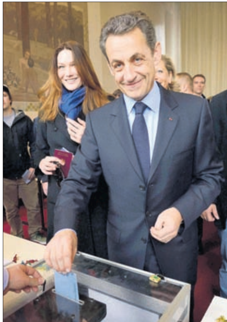
E actual hefe di Estado, Nicolas Sarkozy Sarkozy, kende ta aparece riba e potret aki hincando su voto, lo tin cu purba si convence e votadonan di e 'ultr'a Marine Le Pen (Frente Nacional), cu a logra un 20% danki na su propuestanan populista contra Europa di Euro y contra e inmigrantenan.

Tanto Le Pen y Baurou a bisa cu nan no lo hasi ningun recomendacion di voto na nan siguidonan, aunke lo tin cu mira con e desaroyo di e wega di